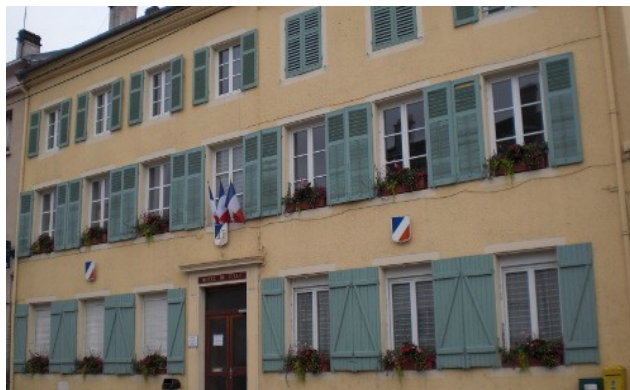
L'Hôtel de Ville actuel (rue de la Mairie)