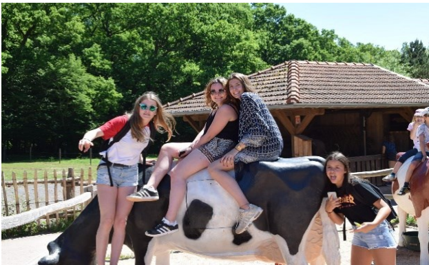
Grand succès lors de la visite de la ferme, les ados se prenant pour de drôles de cow-boys

Grand soleil le vendredi pour la sortie au parc animalier de Sainte-Croix préparée par le comité français : deux bus avec 47 allemands, 50 français et 11 accompagnateurs.