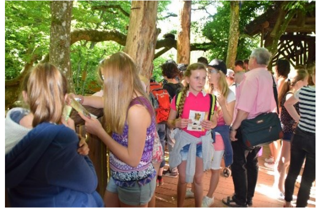
Accrobranches et parcours biodiversité