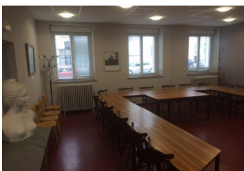
Salle de réunion du Conseil Municipal

Vu la délibération n°2017-01 de la Caisse des Écoles du Regroupement Pédagogique Intercommunal Dolto, fixant la participation des communes à hauteur de 87 € par enfant dans le cadre du forfait pédagogique, considérant l'inscription de 102 élèves scolarisés à l'école Dolto habitant Bayon, M. le Maire propose au Conseil Municipal de verser la somme de 8 874 € à la Caisse des Écoles pour 2017. Délibération adoptée à l'unanimité.