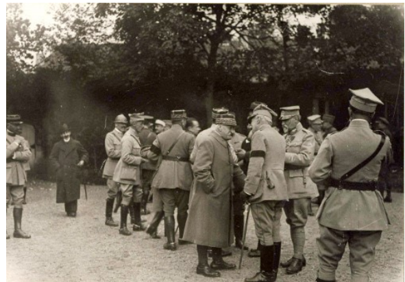
Dans le parc du château, officiers français et polonais à la sortie du banquet.