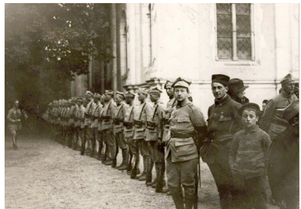
Au château pendant le banquet d'honneur offert par le Général HALLER, la compagnie d'honneur.