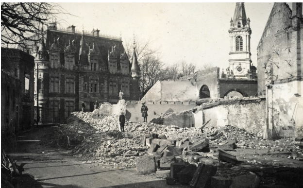
L'actuelle place du Château en ruines après l'attaque allemande du 20 juin 1940

Si le village fut relativement épargné par les combats de la Grande Guerre, n'étant touché que par quelques bombes ennemies en 1914 et en 1918, il n'en fut pas de même au cours de la Seconde Guerre mondiale : le 20 juin 1940, les Allemands canonnèrent puis attaquèrent Bayon, faisant plusieurs victimes parmi les habitants et les soldats défendant le village, détruisant ou endommageant sérieusement une quarantaine de maisons, l'école communale des filles et l'église saint Martin, construite entre 1881 et 1884. La population paya également un lourd tribut aux deux guerres : 64 soldats Morts pour la France en 1914-1918, 20 civils et militaires en 1939-1945.