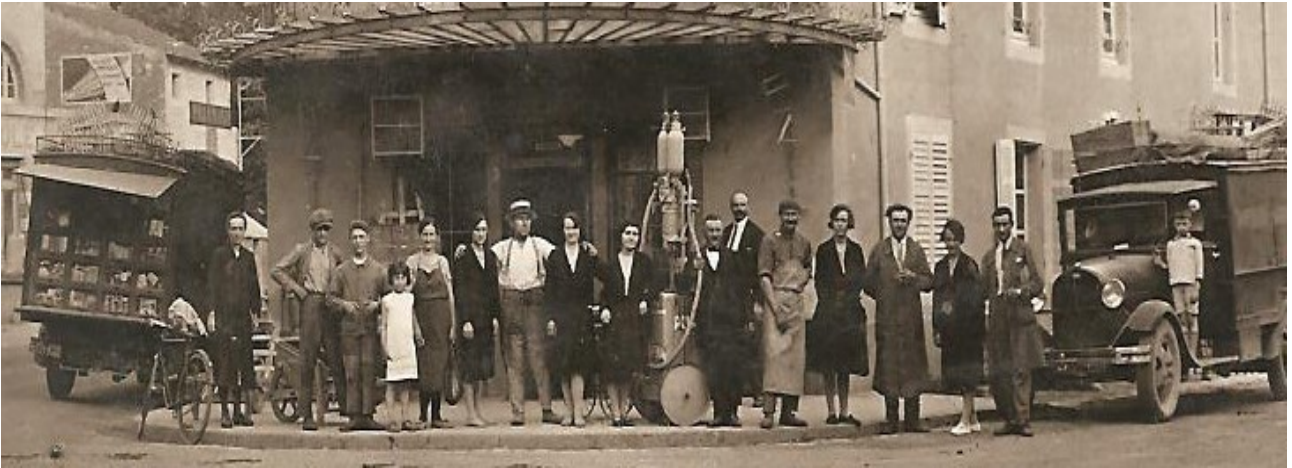
Les employés de la coopérative agricole posent devant l'entrée du magasin vers 1930 (actuel Square des Académiciens, à l'intersection des avenues de la Gare et de Virecourt)

Si le village fut relativement épargné par les combats de la Grande Guerre, n'étant touché que par quelques bombes ennemies en 1914 et en 1918, il n'en fut pas de même au cours de la Seconde Guerre mondiale : le 20 juin 1940, les Allemands canonnèrent puis attaquèrent Bayon, faisant plusieurs victimes parmi les habitants et les soldats défendant le village, détruisant ou endommageant sérieusement une quarantaine de maisons, l'école communale des filles et l'église saint Martin, construite entre 1881 et 1884. La population paya également un lourd tribut aux deux guerres : 64 soldats Morts pour la France en 1914-1918, 20 civils et militaires en 1939-1945.