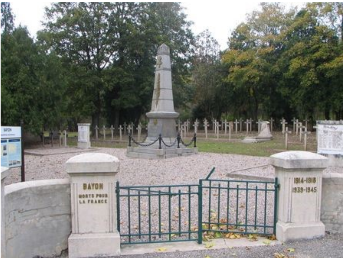
La nécropole nationale de Bayon