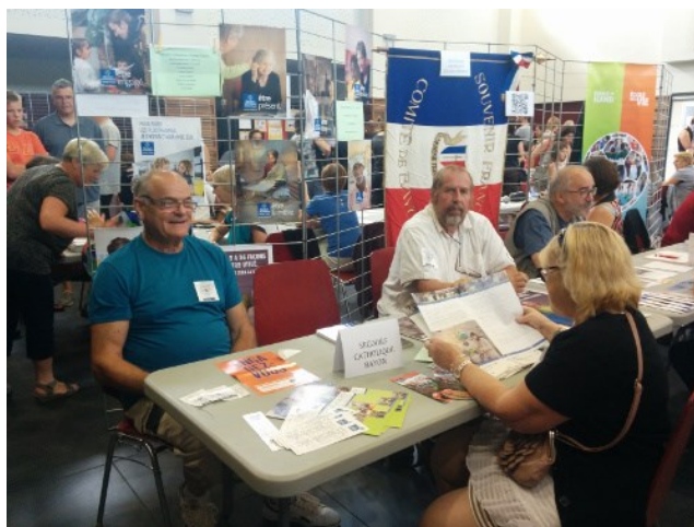
Ci-dessus : participation au forum des associations

Permanences les 2 ème et 4 ème mardis de chaque mois de 10h à 12h au local situé ruelle des Hauts-Fossés. Tél. 06 40 82 77 25