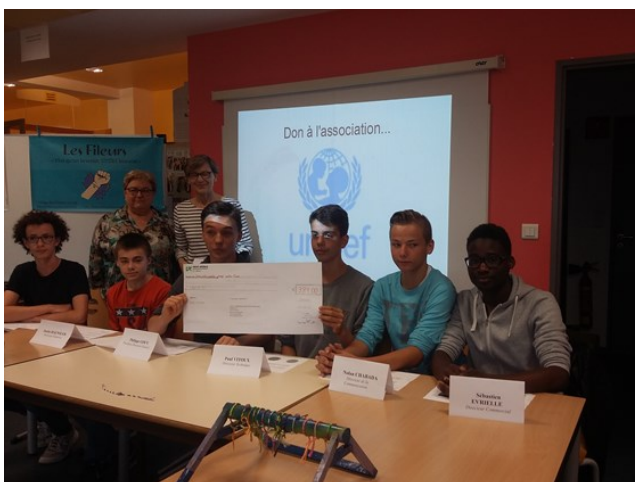
Remise du don de 384 € à UNICEF 54

Suite à une décision lors de l'Assemblée Générale, cette somme a été versée sous forme de don à l'UNICEF 54, signe qu'une entreprise peut aussi être solidaire.