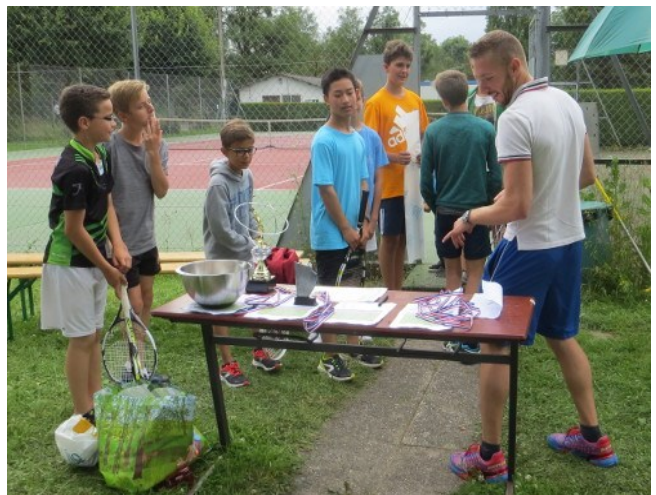
Quelques gouttes seulement... en fin de journée