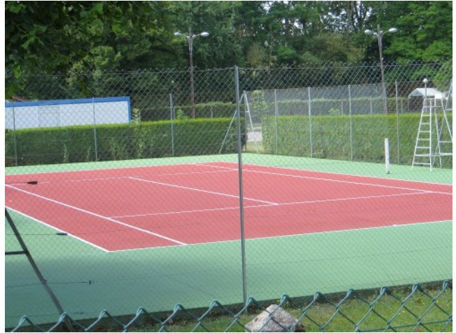
Le court n°1 rénové