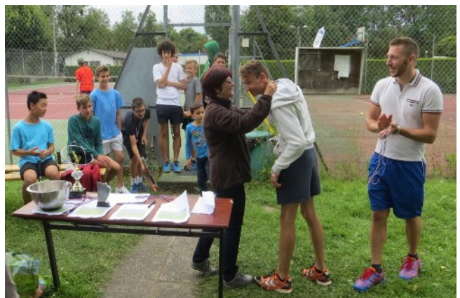
Remise des médailles