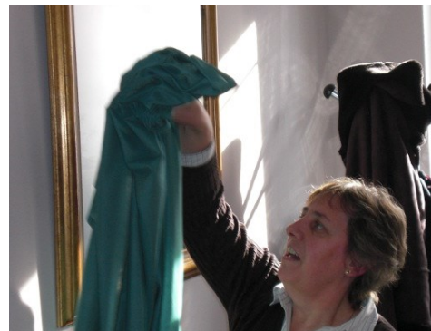
Inauguration de la salle d'honneur en Mairie (2010) Dévoilement des tableaux