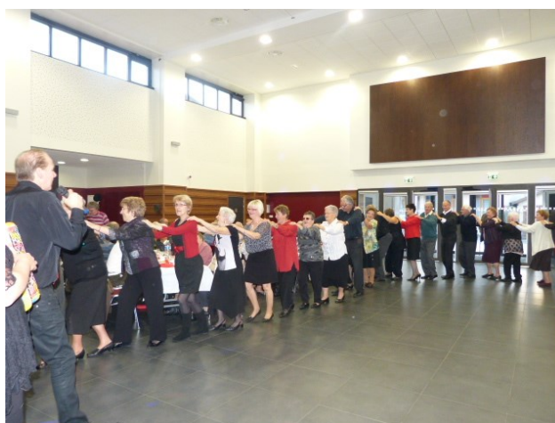
Farandole des Aînés - Novembre 2012

Le CCAS a souhaité conserver l'aspect convivial de la manifestation et finance une partie des frais d'organisation de la journée supportés par la Commune (à hauteur de 8 € par participant).