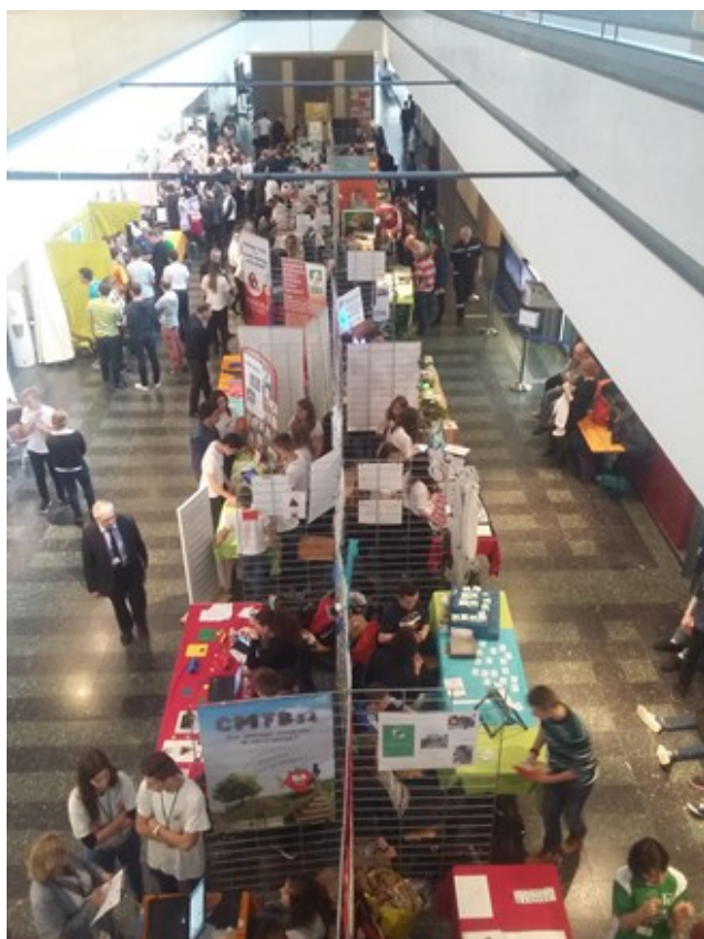
Championnat régional au Conseil départemental

Les mini-entrepreneurs ont participé au Championnat Régional des Mini-entreprises, et même s'ils ne sont pas arrivés en tête du championnat, ils ont montré leur engagement et le professionnalisme tout au long de la journée.