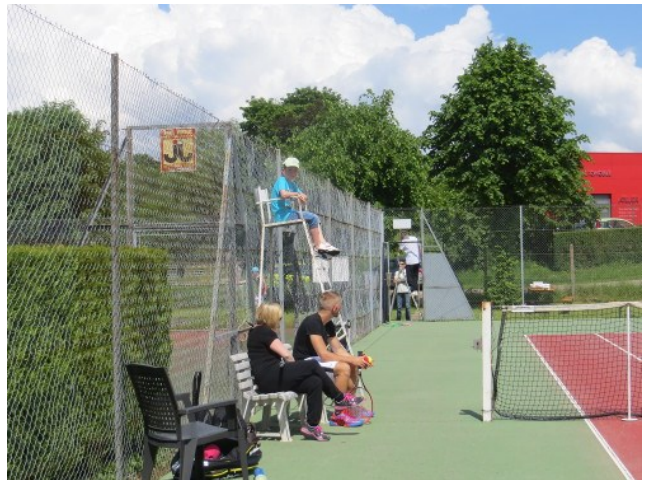
Les parents regardent...