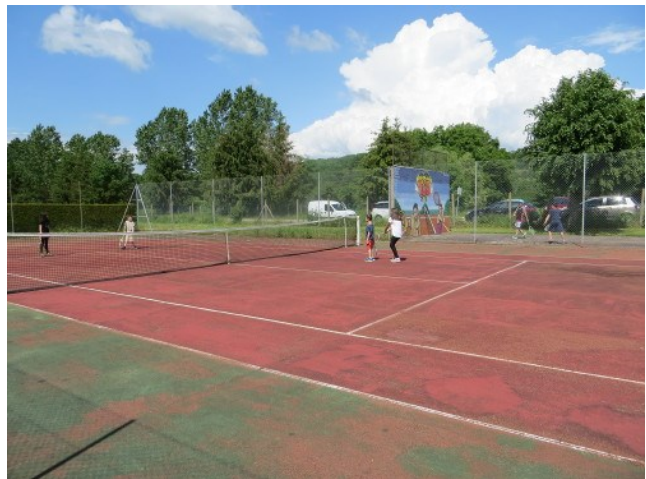
... ou tapent la balle !