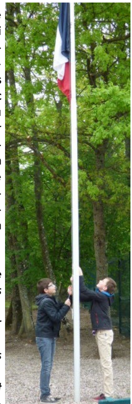
L'envoi des couleurs