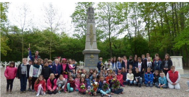
Les élèves au pied du monument aux morts

C'est ainsi que près de 80 enfants des classes du CE1 au CM2 de l'école de La Providence, accompagnés de leurs enseignants, se sont retrouvés le lundi 9 mai à la Nécropole nationale de Bayon pour être les acteurs de cette cérémonie.