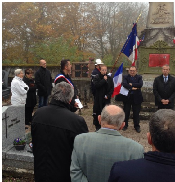
Journée nationale du Souvenir Français 1 er novembre 2015