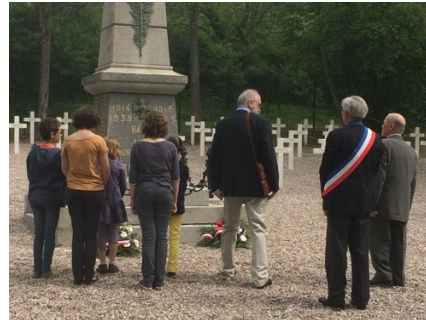
Dépôt de gerbes