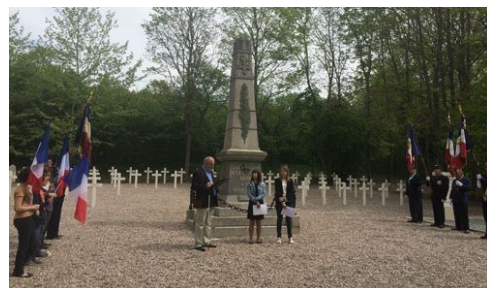
Hommage aux Morts pour la France de 1939-1945